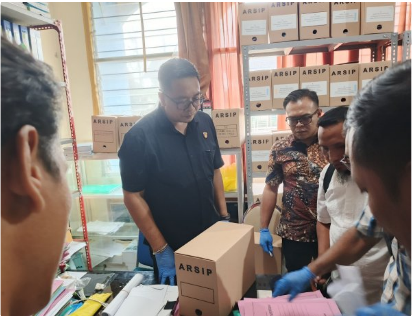
Saat Pengeledahan di Dikbud NTB, Jumat (13/12/2024)