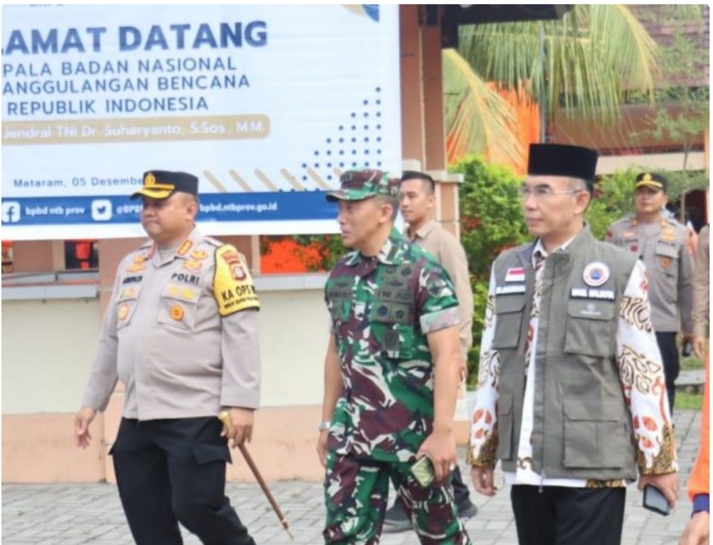
Kapolresta Mataram (Kiri) saat menghadiri acara Peletakan batu Pertama pembangunan gedung Pusdalops BPBD NTB, Kamis (05/12/2024)