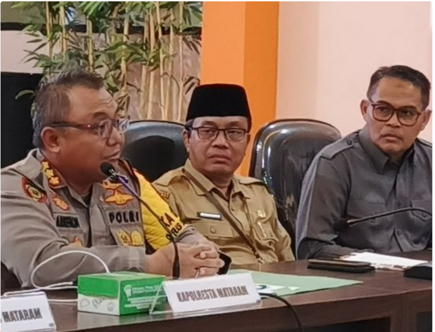
Kapolresta Mataram (Kiri) saat memimpin Konferensi pers akhir tahun, Selagi (31/12/2024)

MATARAM, NTB – Polresta Mataram mengakhiri tahun 2024 dengan menggelar Konferensi Pers Akhir Tahun, sebuah forum transparansi untuk memaparkan capaian dan inovasi yang telah dilakukan selama satu tahun. Kegiatan yang